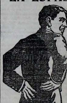
Cada Cuadro Habla por Si

Dolor de espalda y dificultad al orinar son señales de peligro y de que los riñones están tupidos y congestionados, que el sistema se está llenando con ácido úrico y otros residuos venenosos que debían haber sido pasados en la orina.