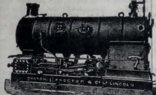
MAQUINA SEMIPLAS PARA LUZ ELECTRICIA.

CATALOGOS En español, portugués, francés y alemán gratis.