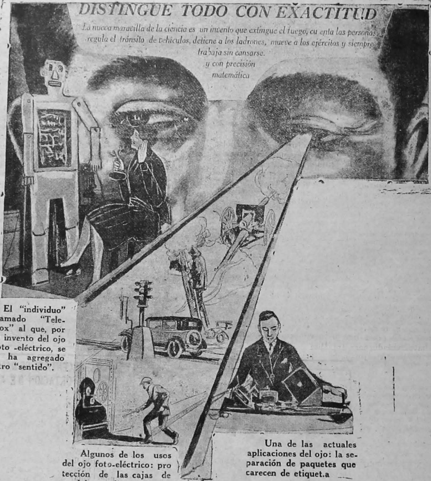
El "individuo" llamado "Televox" al que, por el invento del ojo foto-eléctrico, se le ha agregado otro "sentido".

La nueva maravilla de la ciencia es un invento que extingue el fuego, cuenta las personas, regula el tránsito de vehículos, detiene a los ladrones, mueve a los ejércitos y siempre trabaja sin cansarse y con precisión matemática