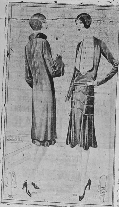
:1042.— Abrigo crespón Romano negro guarnecido de cañadillo al cordoncillo transparente sobre fondo de crespón Romano blanco.