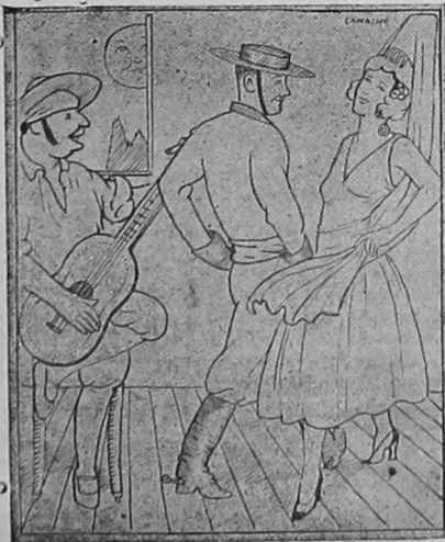
Colore Ud. este dibujo y envíelo a nuestras oficinas con tres cupones, correspondientes al Concurso Infantil.