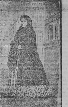
LA NIÑA DEL ROTO

[Traducido especialmente para EL TIEMPO] XXIII CATON Después de las guerras púnicas, Cartago fué completamente derrotado por los ejércitos de Roma. A la ocaída venida se le impusieron pesadas condiciones, y los vencedores nombraban a Manlio, Rey de Numidia, para que molestase a los cartaginenses. Estos enviaron sus emisarios á Roma en demanda de justicia. El Senado apartó indignamente contra Manlio y prometió nombrar árbitros para que solucionasen el asunto. Aquí acaeció de Manlio sobre los territorios de Cartago, Roma manifiesta su reprochación y ofreció impedir al Rey de Numidia persistir en sus arbitrariedades. Pero la política de los romanos tenía