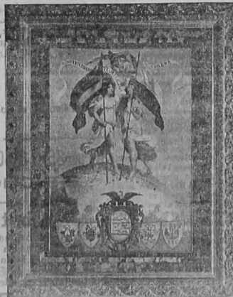
Copia del cuadro alegórico obsequiado por los centros sociales de Guayaquil al pueblo chileno.

(1) He aquí la estrofa original del coro de Eusebio Lillo: Libertad, invocando tu nombre, la chilena y eterna nación, jura libre vivir de tiranos y de extraños, humillados oprimidos.