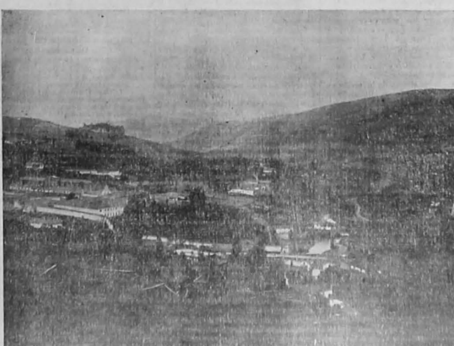
Entrada á Chimbacalle por el lado de la Recoleta, y puente sobre el río Machángara.