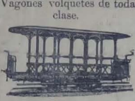
Vagones volquetes de toda clase.