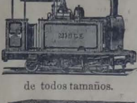
de todos tamaños.