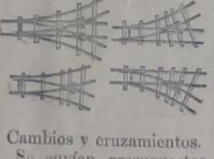
Material fijo y móvil para vías portátiles, permanentes y tranvías.