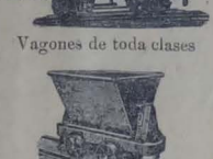
Vagones de toda clase