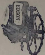
GENERATOR OF EDISON.