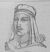
EL SULTAN DE MARRUECOS QUEIERE IR