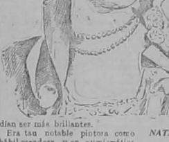
NATALICIO DE LA REINA DEITALIA

Con ese garro no se cuenta, porque es parado escuro.