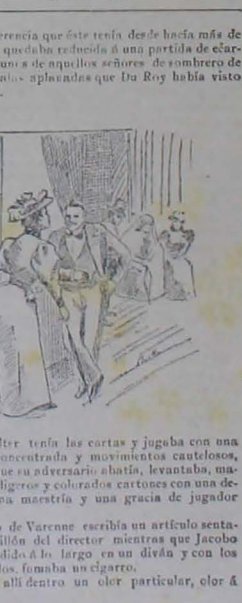
Mr. Walter tenía las cartas y jugaba con una atención concentrada y movimientos cautelosos, mientras que su adversario estaba, levantaba, manijaba los ligeros y colorados cartones con una destreza, una maestría y una gracia de jugador ejercido.