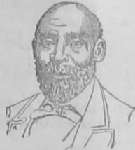
EL REVERENDO JOHN JASPER

El día en que desaparezca para siempre este valle de lágrimas, puede estar seguro de que su nombre no será recordado y honrado por los manifestos y polémicas en que ahora se ocupa, perdiendo el tiempo y malgastando el fóforo de su cerebro, sino por la Historia General del Ecuador, verdadero monumento de labor intemal, que lo sobrevivirá, y que debe terminar lo más pronto, por honra propia y decoro nacional.