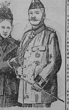
El viaje de los condes de Waidersce

Ya no se puede ni oír más de la revolución La Srta. Fermína Gutiérrez, inquilina de una casa de la calle del Morro, insistía en