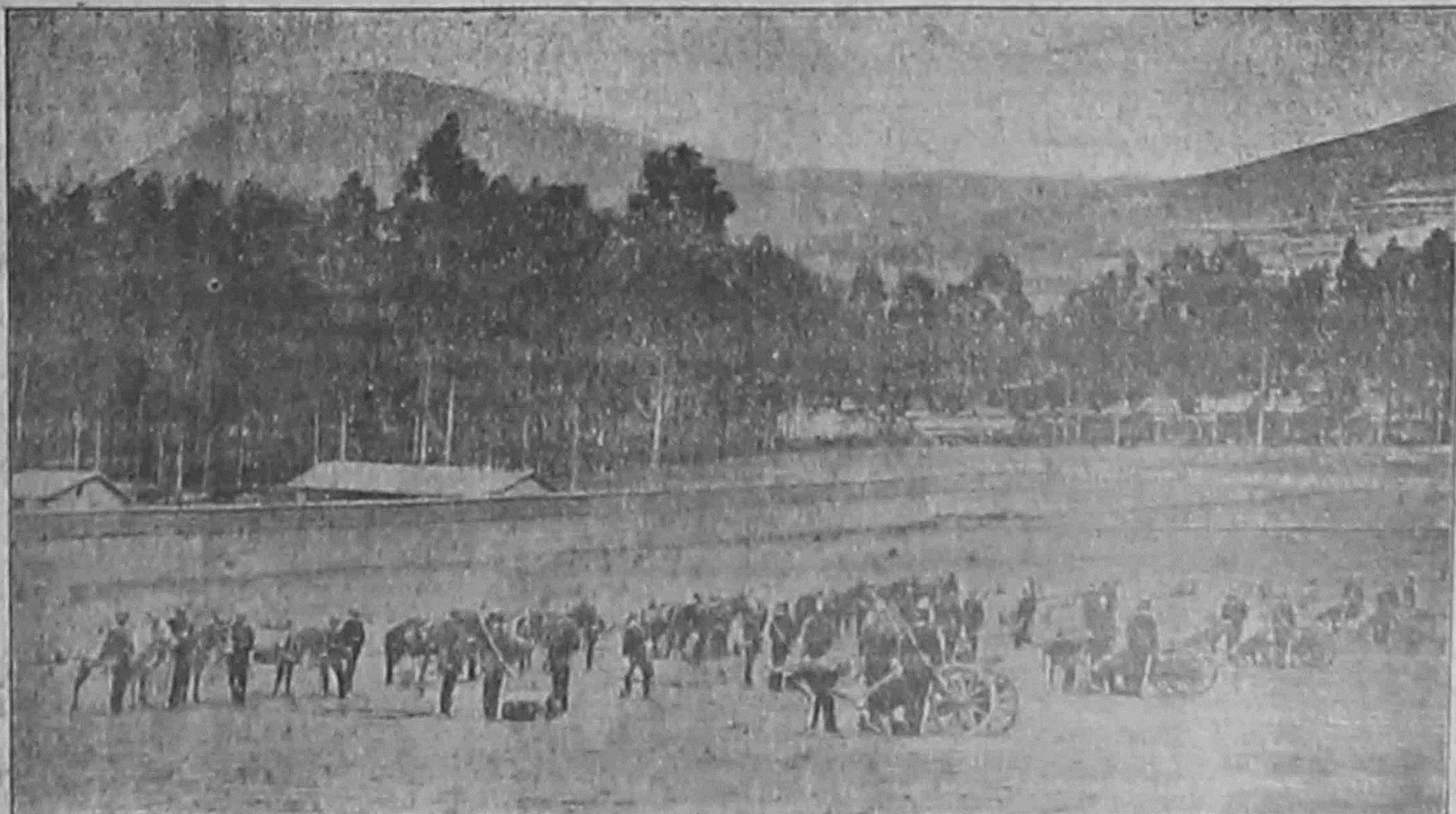
La Escuela de base fundada por el Presidente Alfaro en 1900

Es preciso someter la ley de la gravitación a una comprobación, dice Poincaré, pues que aseguramos que no existe la acción a distancia, o por lo menos, a grandes distancias, pues es que la teoría de la elasticidad nos permite saber que la acción se ejerce a corta distancia. La teoría de Einstein explica que la fuerza de atracción no se ejerce sobre las masas mutuamente, sino que la influencia la ejerce en la curvatura del espacio; de manera que el su trayectoria, al aproximarse un astro a otro, la figura que se traza en su recorrido es del tipo de las masas, se apartan en esos puntos, ya sea en el punto de su recorrido, o también hacia arriba o hacia abajo, según la posición del astro involucrado. Esta acción sobre el espacio es la que impide el choque de las masas unas contra otras, y es de uso de la gravitación. Einstein reduce la