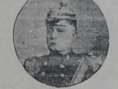
General Dn. Ulpiano Páez.

La Muerte es la eterna compañera del Silencio;