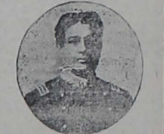
General Dn. Medardo Alfaro.

Para condenarlo a muerte, no se aploó a la frase consagrada antaño, no se dijo que se resuscitaba el Código de Torquemada, "para ejemplo y terrible escarmiento de los pueblos"; se pronunció una locución que recogerá la Historia para estigmatizar a los asesinos: "Principiará a limpiarse por la cabeza el escalafón mili-