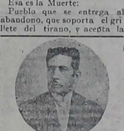
General Dn. Manuel Serrano

Esa es la Muerte; Pueblo que se entrega al abandono, que soporta el gilleto del tirano, y acepta la