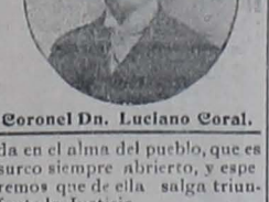
Coronel Dn. Luciano Coral.

y, el Verbo es Vida; sembremos el germen de esa Vi