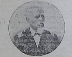
General Dn. Eloy Alfaro.

deglottados los hombres, destruidos los templos, profanados los cadáveres; al volver, no de su victoria, porque no supo combatir, sino del asesinato y del pillaje, le recibe la mu