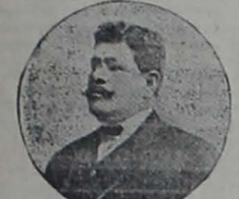
General Dn. Flavio E. Alfaro.

Noche triste, melancólica, casi sinical. Todo emudece de terror y espanto! La Ciudad del Trabajo, la metrópoli