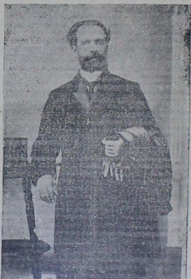
Señor General Ramón González Valencia

En las negociaciones análogas de los últimos tiempos, se ve que los Estados contendientes han apelado á la solución directa. En otra ocasión hemos señalado algunos de estos arreglos. El más reciente es el celebrado en este año entre Estados Unidos y Canadá Mr. Knox y el Embajador británico.