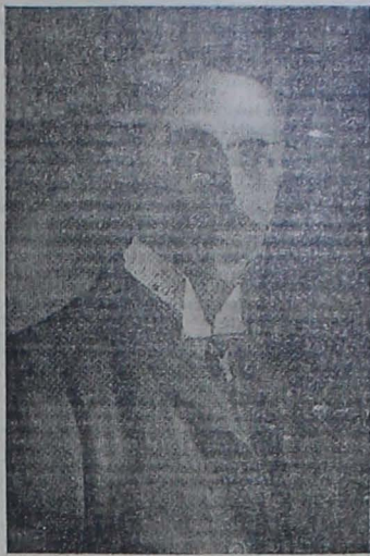
Excmo. Sr. Dr. Carlos E. Restrepo

Hoy a las 3 p. m. asumirá la Presidencia de la República de Colombia, el Sr. doctor don Carlos E. Restrepo. Deseamos a la noble patria de nuestros hermanos del Norte, con tan prestigioso mandatario, el desarrollo próspero y feliz en to la su or ganización.