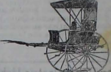
CARRUAJE "MURRAY" Precio, $61.50 Am. Libre a bordo del buque en New York.

WILBER H. MURRAY MFG. CO. CINCINNATI, OHIO, E. U. de A.