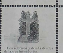
Los sobrinos y demás decedidos de la que fué señorita

Se han los dos y media de la madrugada ingresaron á los calabozos de Policía 15 contraventores acusados de faltas de ferentes.