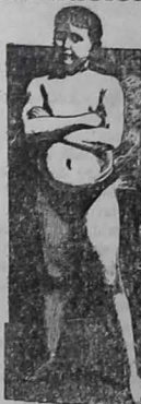
EDAD 11 AÑOS

La transformación maravillosa de un ser endeble y raquítico en un adolescente fuerte, robusto y sano, como lo demuestra su atlética figura, fué obra realizada por la