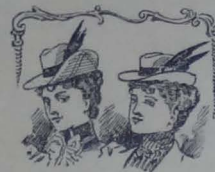
Sombrero Alpino, última moda. Ditojo especial para 'El Garro del Praxto'

Como última novedad ofrecemos a nuestras lectoras los modelos del sombrero Alpino, á propósito para fin de verano y para principio del invierno.