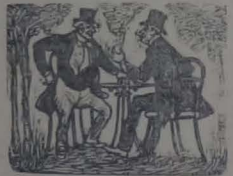
En la cantina

El doctor Pacheco que llegó pocos momentos después del desgraciado acontecimiento, quiso hacerle la primera curación, pero no fué posible, porque, como dijimos arriba, había fallecido casi instantáneamente.